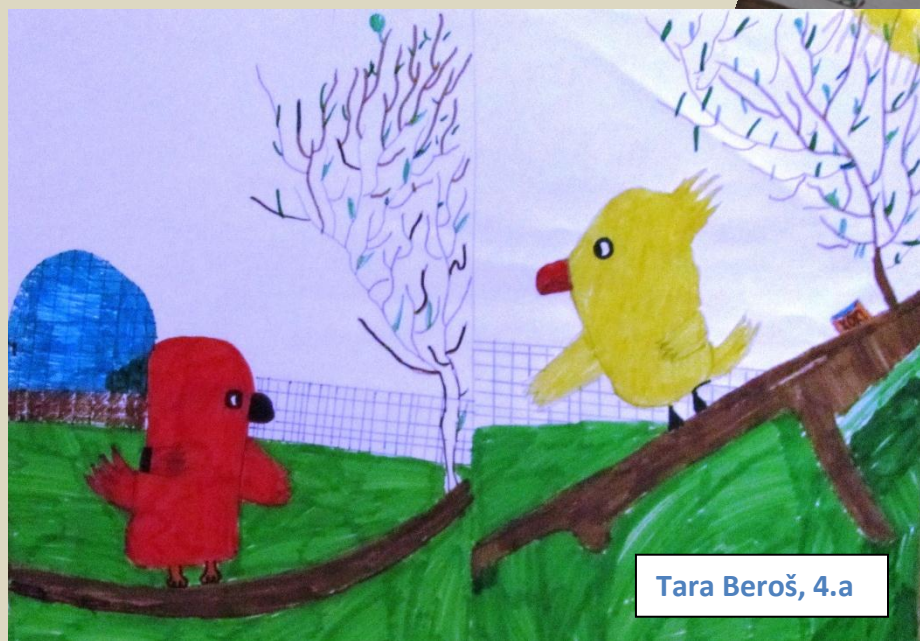
Tara Beroš, 4.a