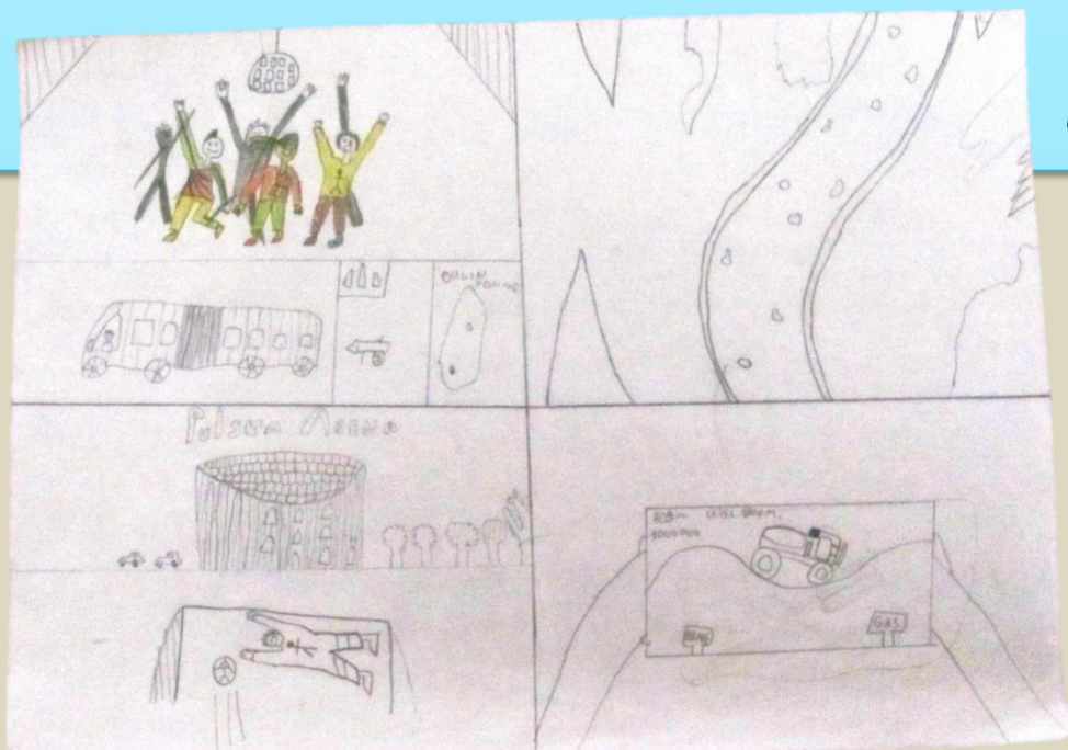
Noa Igrec, 4.a

Rano ujutro spremili smo kufere, doručkovali i uputili se prema Ogulinu. Bili smo u Muzeju, vidjeli smo puške, vojne slike i još puno različitih stvari. Vidjeli smo Đulin ponor, ručali i vratili se u Split.