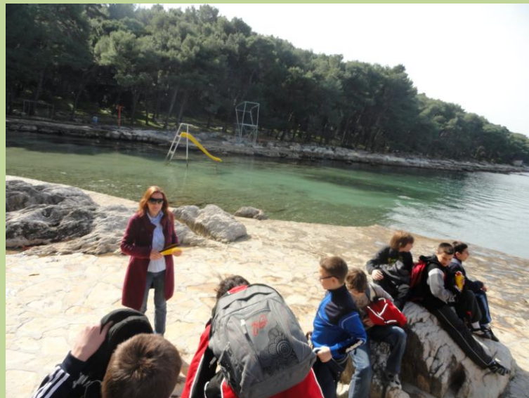
Nastava hrvatskoga jezika

Svi smo se složili da je učenje u prirodi mnogo zanimljivije od sjedenja u školskim klupama. Sve ono što smo učili u školi, na Marjanu smo vidjeli i doživjeli pa nam je tako učenje bilo zabavnije.