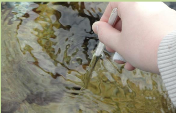
Provjeravanje temperature mora

O prirodi je najljepše učiti upravo u prirodi. Produbili smo svoja znanja o životu u moru i uz more te naučili prepoznavati životinje, biljke i alge.