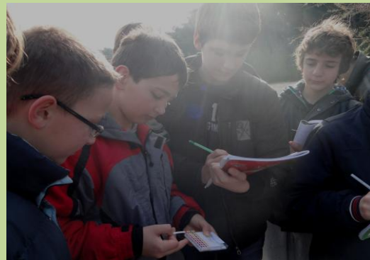
Očitavanje rezultata pokusa