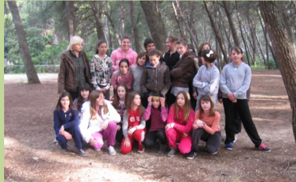
Djevojčice s nastavnicom nakon tjelovježbe

U okviru nastave Hrvatskoga jezika na Marjanu bavili smo se zavičajnim motivima i zavičajnim govorom.