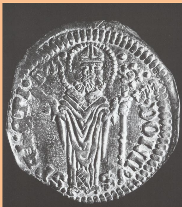
Srebrni groš gradskoga kneza Hrvoja, lik sv. Dujma na prednjoj strani

Papa Siksto V. dao je naslikati slike svetoga Dujma u crkvi svetoga Jeronima u Rimu. Svečeve slike nalaze se i u više mjesta u okolini Splita pa i dalekom Sankt Petersburgu. Julije Bajamonti skladao je oratorij „Prijenos svetog Dujma“ 1770. godine prigodom prijenosa relikvija svetog Dujma u novi svečev oltar u splitskoj katedrali, a lik svetoga Dujma nalazi se i na kovanom srebrnom novcu iz razdoblja od 1327. do 1357. godine.